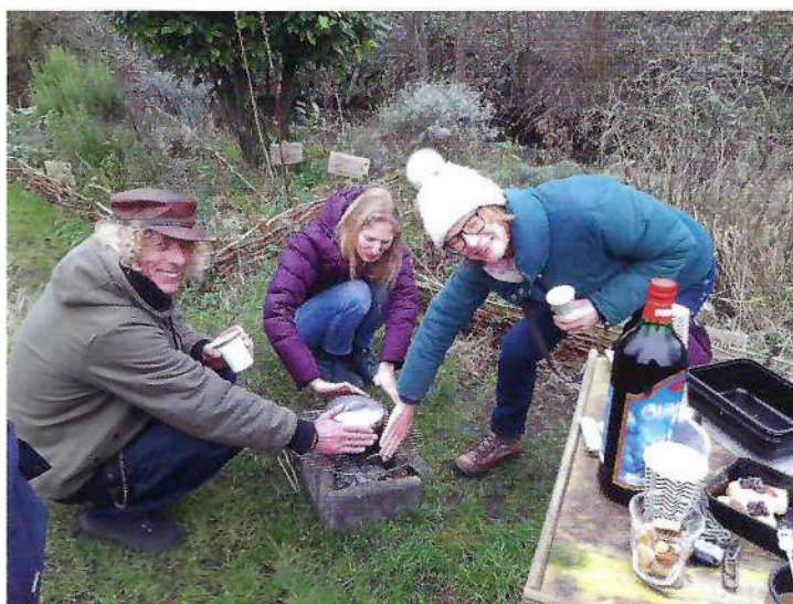
De uitbreiding van 't Mientje.

Kom een keertje kijken en dan ben je ook welkom om meer te horen over het nieuwe insectenhotel, de kruiden en de groenten. Er is grote kans dat er voldoende laurierblad is om daarvan wat mee naar huis te nemen. Laurier is echt lekker in veel vleesgerechten. We zijn er meestal op zaterdag van 11.00 tot 13.00 uur, soms ook op andere momenten. Wees welkom! Kom gerust langs en stel je vragen.