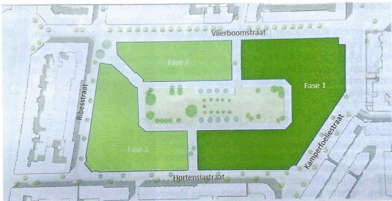
De door Haag Wonen gewenste planning: Fase 1 sloop in 2023, fase2 sloop in 2024.